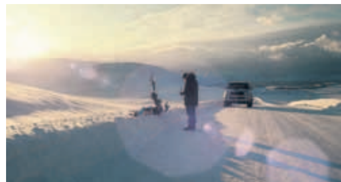
GNAD Zum dritten Mal nach „Der ferne Wille“ und „This is Love“ spielt Jürgen Vogel die Hauptrolle in einem Drama von Matthias Glasner. Zentrale Themen sind wieder Schuld, Sühne und Ergebung. Vogel verkörpert den deutschen Ingenieur Niels, der zusammen mit seiner Frau Maria und dem gemeinsamen Sohn im norwegischen Hammerfest wohnt. Als Maria eines Nachts Fahrerflucht begeht, gerät die Familie aus der Balance. D: 130 Min., R: Matthias Glasner, D: Jürgen Vogel, Birgit Minichmayr

WETTBEWERB Von Müttern, Leibärzten und Kindersoldaten: 18 Filme, darunter drei deutsche, konkurrieren um den Goldenen Bären